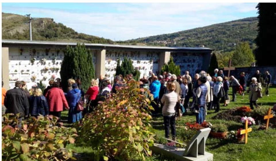
nella foto: visita alla tomba di don Orfeo

Mi piace concludere questo mio contributo con un pensiero espresso da una mia amica presente al pranzo: "Don Orfeo è come un albero che ha messo radici in cielo e i cui frutti cadono copiosi sulla terra."