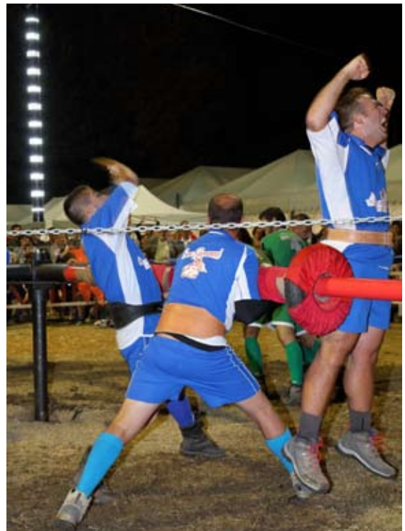
nella foto: l'esultanza del San Giovanni nel momento della vittoria

Il Trofeo "Oriano Capirossi" per il quartiere che ha vinto più velocemente è andato al San Giovanni. (dal sito internet Parrocchie di S.Paolo e S.Giacomo)