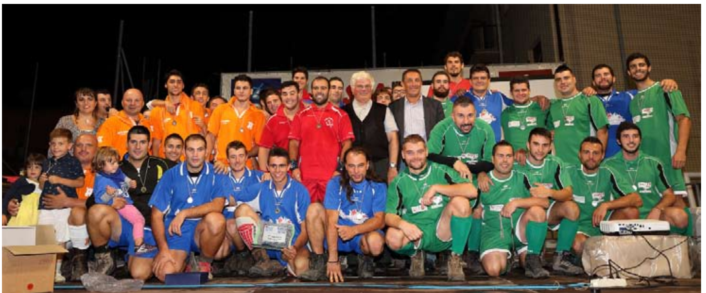
nella foto: il gruppo di tutti i tiratori della città